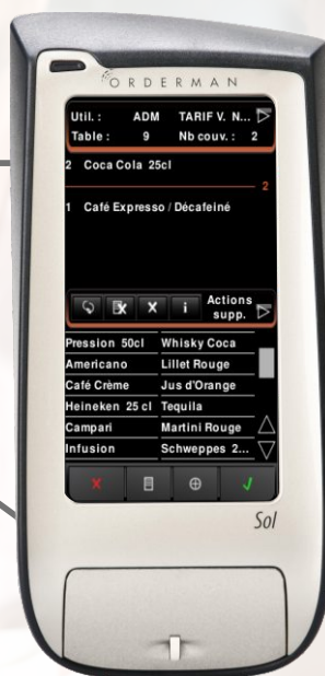
Télécommande Orderman Terminal durci. Technologie Radio